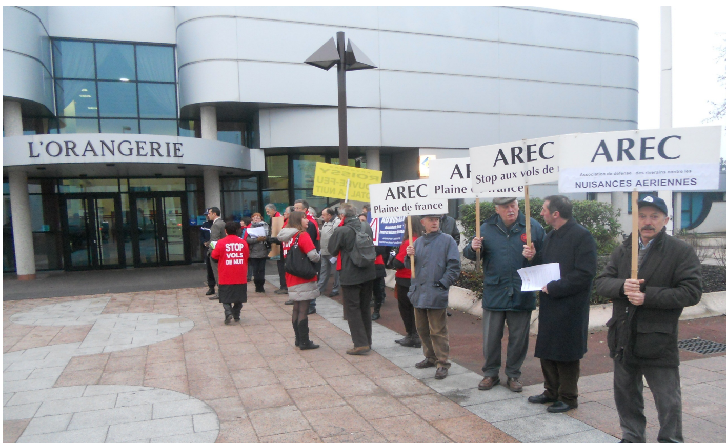
L'AREC présente lors des rencontres du Grand Roissy

Les grandes lignes sont définies dans les déclarations du 25 janvier lors des Rencontres du Grand Roissy (Voir article dans ce bulletin)